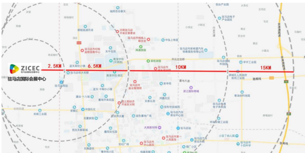
会展中心地理位置图

驻马店国际会展中心位于五峰山大道与开源大道交叉口西北侧，距离市行政文化中心 6.5 公里、距驻马店高铁站约 2.5 公里、距驻马店京港澳高速 G4 京珠高速入口 14.7 公里。